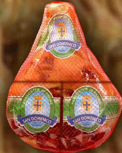
" A Tranci "