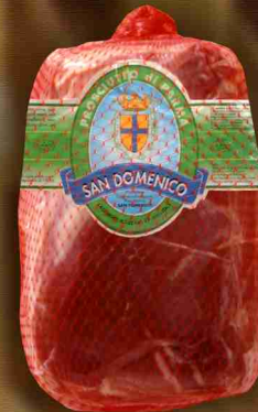
" Mattonella "