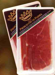
" Affettato "