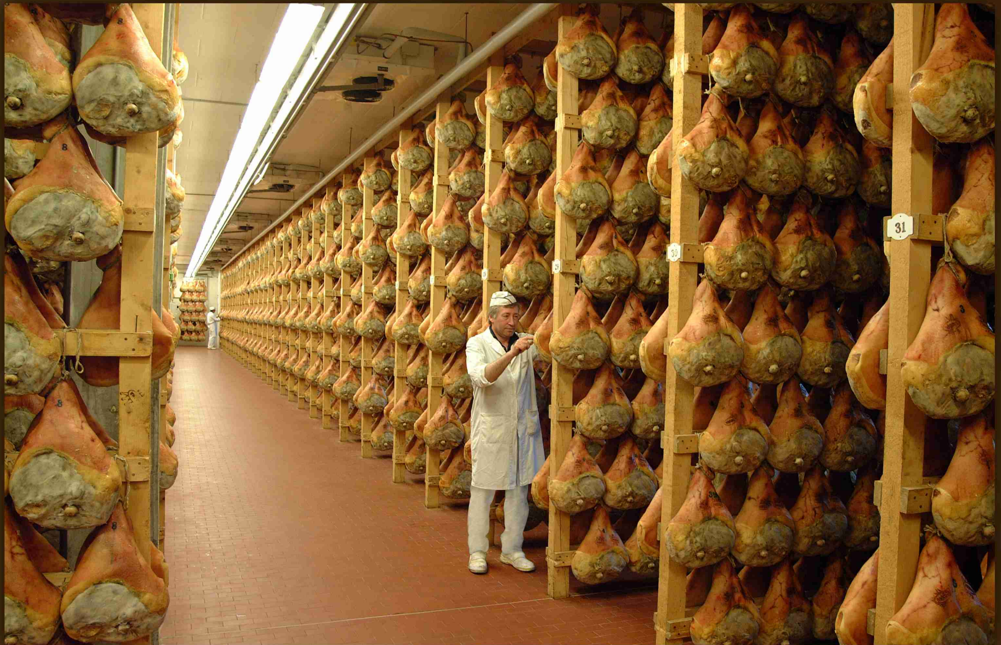
Stagionatura in cantina