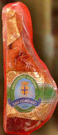
" Dimezzato "