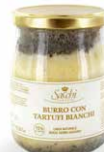
BURRO E TARTUFO (CON TARTUFI BIANCHI AL 15%)