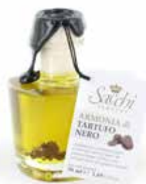
ARMONIA DI TARTUFO NERO CON TARTUFO ESSICCATO