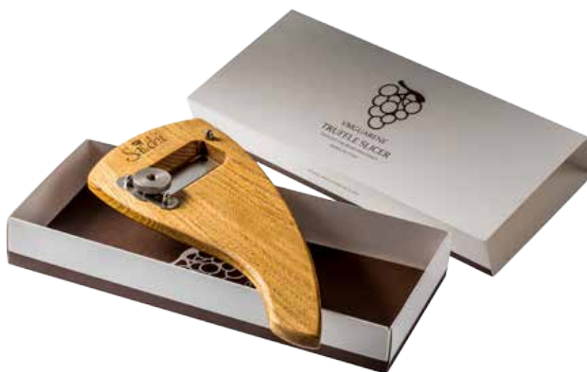
AFFETTATARTUFI IN LEGNO CON LAMA LISCIA