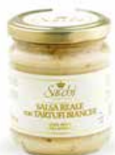
SALSA REALE (CON TARTUFI BIANCHI AL 15%)