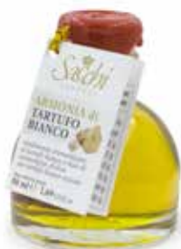
ARMONIA DI TARTUFO BIANCO CON TARTUFO ESSICCATO