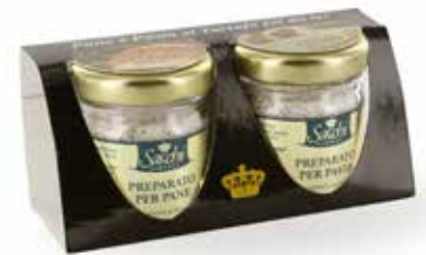
DUO PANE & PASTA