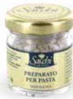
MISCELA AL TARTUFO PER PASTA FRESCA