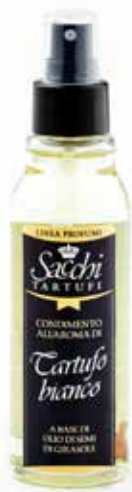
OLIO DI SEMI DI GIRASOLE spray aromatizzato al tartufo bianco