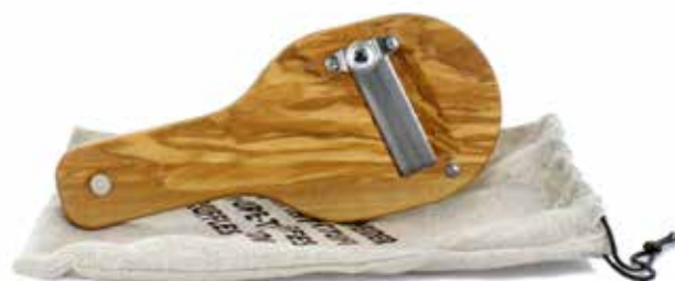
AFFETTATARTUFI IN LEGNO D'ULIVO