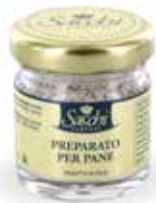
MISCELA AL TARTUFO PER PANE