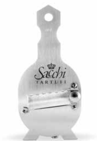
AFFETTATARTUFI IN ACCIAIO