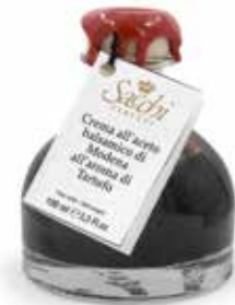
CREMA ALL' ACETO BALSAMICO DI MODENA aromatizzato al tartufo bianco