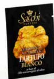
OLIO EXTRAVERGINE DI OLIVA aromatizzato al tartufo bianco