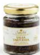
SALSA TARTUFATA (CON TARTUFO ESTIVO AL 15%)