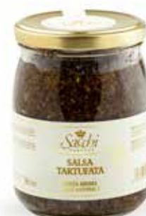
SALSA TARTUFATA (CON TARTUFO ESTIVO AL 15%)