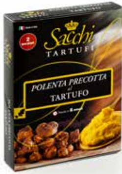
POLENTA PRECOTTA AL TARTUFO