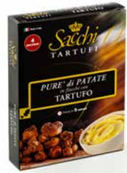
PURE' DI PATATE CON TARTUFO