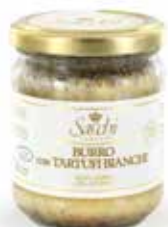
BURRO E TARTUFO (CON TARTUFI BIANCHI AL 15%)