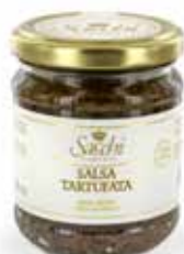
SALSA TARTUFATA (CON TARTUFO ESTIVO AL 15%)