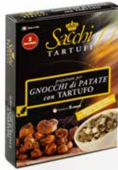
PREPARATO PER GNOCCHI DI PATATE CON TARTUFO