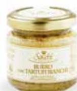
BURRO E TARTUFO (CON TARTUFI BIANCHI AL 15%)