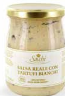
SALSA REALE (CON TARTUFI BIANCHI AL 15%)