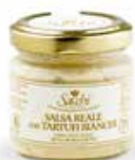
SALSA REALE (CON TARTUFI BIANCHI AL 15%)